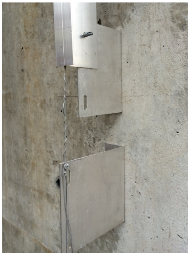
Figura 5. Referência de prumo para execução da Fachada Ventilada

Fachada Ventilada: Sua estrutura em perfis de alumínio permite a montagem conforme as necessidades da edificação, as ancoragens fixadas com chumbadores proporcionam o alinhamento da estrutura para afixação dos perfis verticais “T”, esse sistema por sua vez permite a execução após a verificação dos níveis das prumadas, fazendo com que a fachada garanta verticalidade adequada.