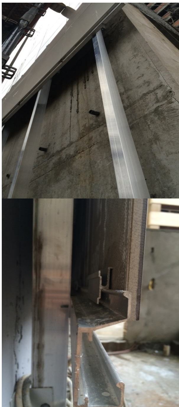
Figuras 2 e 3. Afastamento do revestimento cerâmico da alvenaria