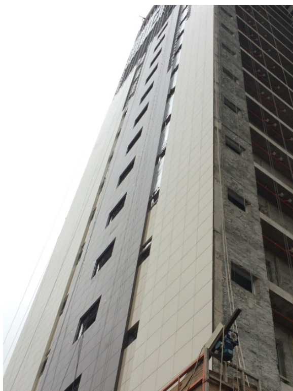
Figura 4. Volumes arquitetônicos na Fachada Ventilada

Pode-se considerar então uma economia de tempo de aproximadamente 58%.